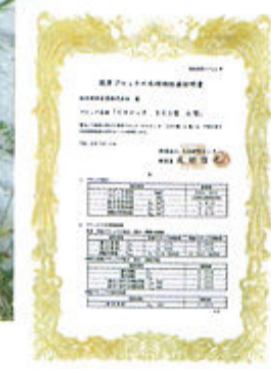
水理特性値証明書