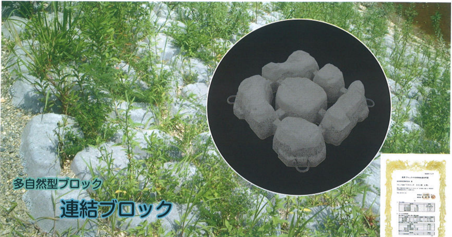
多自然型ブロック 連結ブロック